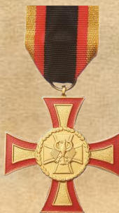
grosses Ehrenkreuz des GDC in Gold am: 01.01.2017