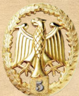
Abzeichen für 5-monatige Zugehörigkeit zum Arma Squad am: 01.03.2016