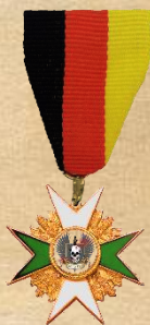
Ehrenmedaille des GDC am: 01.12.2015